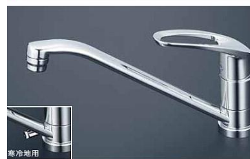
KM5011T 流し台用シングルレバー式混合栓